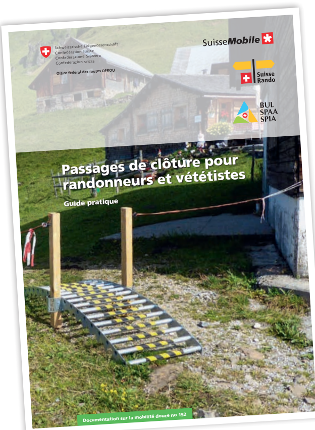
Le guide « Passages de clôture pour randonneurs et vététistes » peut être téléchargé sur notre site internet (voir encadré).

L'Office fédéral des routes (OFROU) a élaboré le guide pratique « Passages de clôture pour randonneurs et vététistes » en collaboration avec divers partenaires. Son but est d'aider à la mise en place de passages de clôture appropriés en fonction du bétail, de l'utilisation du chemin ainsi que des ressources humaines et financières à disposition. Il s'adresse aux personnes et aux organismes qui sont responsables de la planification, de la construction et de l'entretien de ces structures. Le guide peut être téléchargé sur notre site internet (voir encadré).