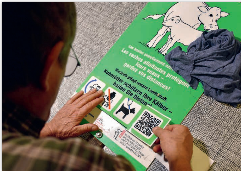
Pour compléter les anciens panneaux « Les vaches allaitantes protègent leurs veaux », un autocollant avec des pictogrammes et un code QR est disponible auprès du SPAA.

pâturages, de planifier des mesures appropriées et de les documenter. La check-list occupe aujourd'hui une place importante comme preuve du devoir de diligence des détenteurs d'animaux dans des cas juridiques. Elle doit être remplie chaque année avant le début de la saison de pâture, pour chaque parcelle, et doit être conservée.