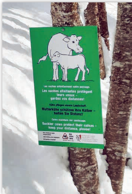
Attention ! Le panneau d'avertissement ne doit être installé que lorsque le troupeau se trouve réellement sur le pâturage.