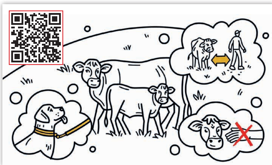
L'été dernier, des petits clips de film « Rencontre avec des vaches ? Les bons réflexes à adopter ! » ont été largement diffusés sur nos réseaux sociaux. Cette vidéo se trouve sur www.beef.ch . Merci beaucoup de la partager sur les réseaux sociaux et de l'intégrer à vos sites internet.

Le dépliant « Les vaches allaitantes protègent leurs veaux » a aussi été actualisé et complété avec une